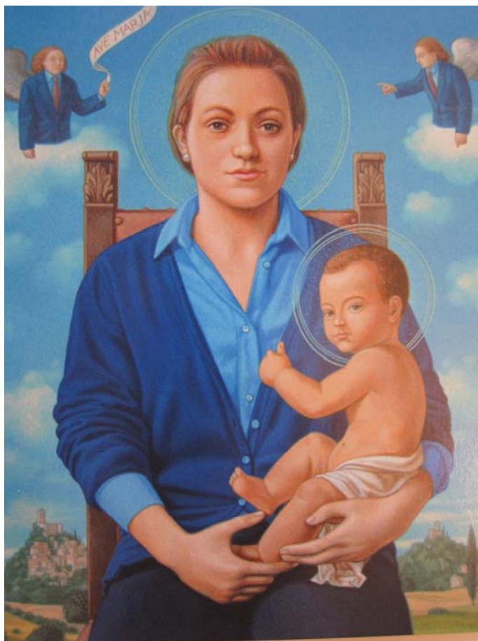
La cartolina postale che ha vinto il premio