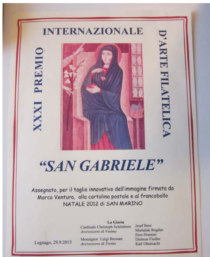
La pergamena del Premio